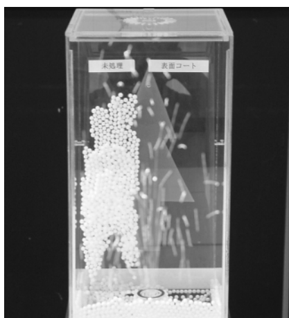
帯電防止コート材