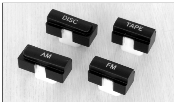
レーザーカット仕様(素材：ポリカーボネート)