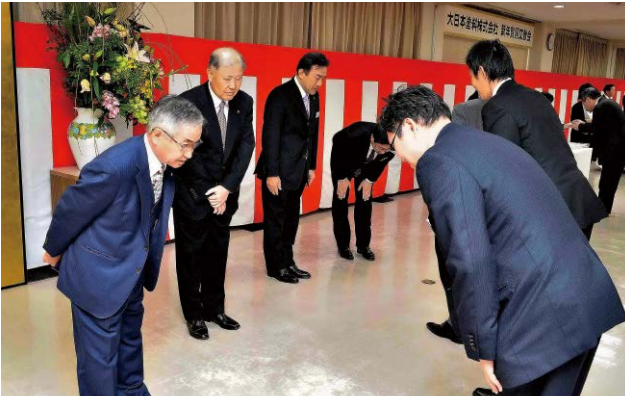
賀詞交歓会(本社・大阪事業所)風景

2018年1月、本社・大阪事業所と東京営業本部において賀詞交歓会を開催しました。会場では取引先や協力会社などへ感謝の意を表わすとともに、当社の経営理念である「新しい価値の創造を通じて地球環境や資源を護り、広く社会の繁栄と豊かな暮らしの実現に貢献できる企業を目指します。」のもと、お取引先と一体となって塗料事業を通じて社会の発展に貢献すべく事業展開を行う決意を表明しました。