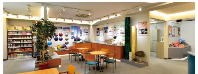
DNTグループショールーム

当社の新商品・機能性商品をはじめ、家庭用塗料の店頭展示、ブラックライトで照射すると幻想的なビジュアルが出現する蛍光塗料コーナーやLEDランプの展示など、役に立つ情報を楽しみながらご覧いただけます。ぜひ一度お立ち寄りください。