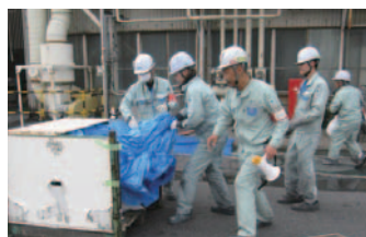
小牧事業所の漏洩訓練