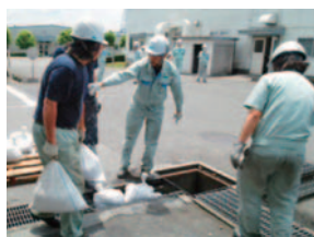
那須事業所の漏洩訓練

有害な化学物質が外部に漏れ出すと地域社会と周辺環境に深刻な影響をもたらすため、那須および小牧の両事業所では漏出事故に迅速に対応するための訓練を定期的に行っています。