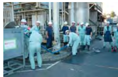
那須事業所の漏洩訓練