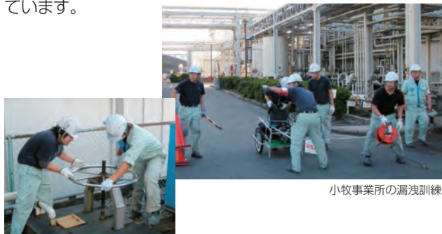
小牧事業所の漏洩訓練

有害な化学物質が外部に漏れ出すと地域社会と周辺環境に深刻な影響をもたらすため、那須および小牧の両事業所では漏出事故に迅速に対応するための訓練を定期的に行っています。