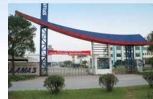
LILAMA3-Dai Nippon Toryo Co., Ltd. (ベトナム)