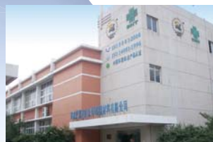
AJISCO-DNT(Ningbo) Paint Co., Ltd. (中国)