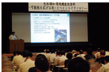
「DNT環境セミナー」大阪会場風景

セミナーでは建築塗装分野の動向や国内外における地球温暖化防止活動の現状、公共建築工事標準仕様書と建築工事管理指針の改定概要などの基調講演のあと、ゲストの講師から高日射反射率塗料(遮熱塗料)の展開、耐火塗料の施工指針(案)の制定、カラーとペイントの可能性についての講演、さらに当社技術スタッフによる「建築塗料で提案する効果的な色彩設計～高日射反射塗料の最新動向」「人と地球に優しく鋼構造物を護る防食技術～耐火塗料システムとVOC削減仕様について」に関する解説など多様な情報を提供しました。