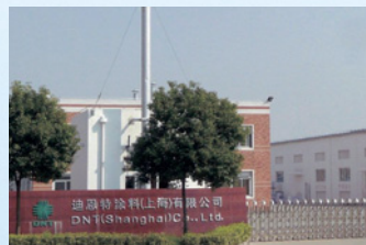
DNT (Shanghai) Co., Ltd. (中国)