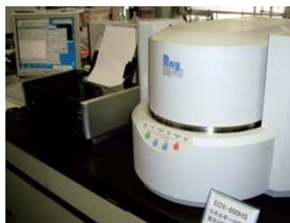
EDX(エネルギー分散型蛍光X線分析装置)