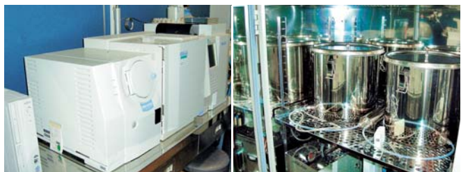
小型チャンバー法VOC測定装置