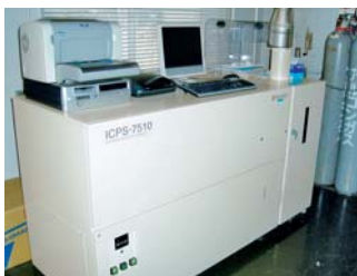
ICP(誘導結合プラズマ)発光分析装置