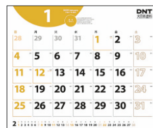
「2009 DNTカレンダー」D型(2型)の人の見え方