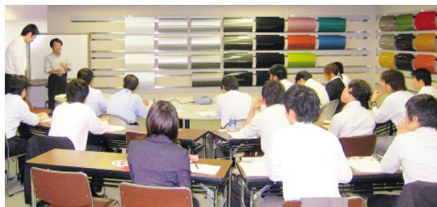
「色彩入門コース」講座風景

一方、中堅以上の方に対しての座学としては、効率的な営業活動実現のための「営業スキル向上コース」や、最近の安全・環境に関する知識を学ぶ「環境安全コース」を、塗料に関しては、各業種ごとに専門的な知識を学ぶコースを実施しました。