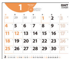
「2009 DNTカレンダー」一般の人の見え方

DNTカレンダー・手帳の休日色の選定や、当社カタログの制作時には、一般の人とは色の見え方が異なる人に対して、区分しやすい配色になるように配慮しています。