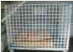
段ボールのリサイクル