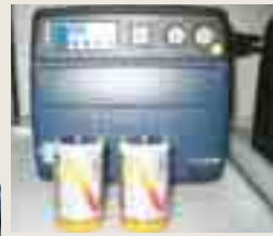
充電式電池の利用