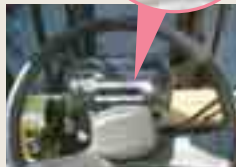
フォークリフトのアイドリングストップ表示