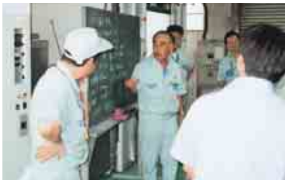
金属機械塗料コース

また、この「塗料相談室」にお寄せいただいた貴重なご意見・情報等は、直ちに社内の関係部署に連絡して、以後の活動に役立たせていただいています。