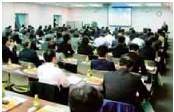
「環境セミナー」風景