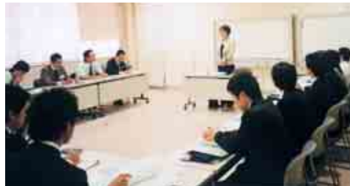
ビジネスマナー基礎コース