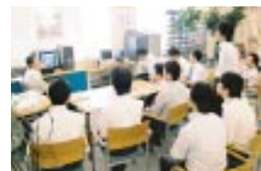
「色彩概論」のコンピューター・グラフィックス講習