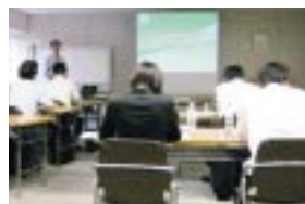
「環境対応形塗料」講習

これ以外にも建築、構造物、自動車補修など、各業種ごとや地区ごとに勉強会を随時開催して、現下の国内外の動向、法規制の動向、これに対する当社の取り組み状況の情報提供を行い、ユーザーへの良きパートナーとなる人材の育成を図っています。