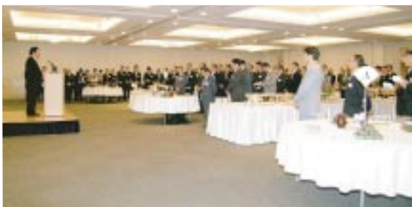
お取引先懇談会風景

当社では「お取引先懇談会」を定期的で開催しています。主要なお取引先をお招きし、日常折衝を行っている資材本部員や技術員だけでなく、当社社長や各部門の役員も出席し、お取引先に対して「大日本塗料の現状と今後」について説明しています。このような機会を通じて、大日本塗料をご理解いただき、さらなるご協力を得ながら「双方にとってメリットのある関係」を構築していきます。