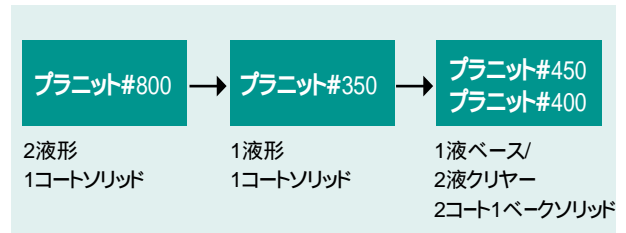
図2 バンパ-用ソリッドの商品体系

次にプラニット#450クリアーでは、耐汚染性の向上とハイソリッド化によるVOC削減を行った。耐汚染性向上に関してはモノマー組成の一部変更と塗膜のTg及び架橋密度のアップを行い、ハイソリッド化に関しては主剤アクリルポリオールおよび硬化剤イソシアネートの低分子量化で自動車メーカーの要求するVOC450g/L以下を達成した。