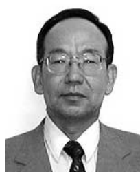
木原 均 Hitoshi KIHALA