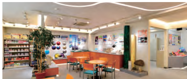
DNTグループショールーム

当社の新商品をはじめ、カラープランを提案する住まいの塗り替えコーナーのほか、家庭用塗料の店頭展示、ブラックライトで照射する幻想的な映像など、役に立つ情報を楽しくご覧いただけます。ぜひ一度お立ち寄りください。