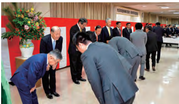
「賀詞交歓会(大阪本社)」風景

2017年1月、大阪本社と東京営業本部において賀詞交歓会を開催しました。会場では取引先や協力会社などへ感謝の意を表わすとともに、当社の経営理念である「新しい価値の創造を通じて地球環境や資源を護り、広く社会の繁栄と豊かな暮らしの実現に貢献できる企業を目指す」のもと、「重防食のDNT」ブランドを国内外へ浸透させるとともに、お取引先と一体となって、塗料事業を通じて社会の発展に貢献すべく事業展開を行う所存である決意を表明しました。