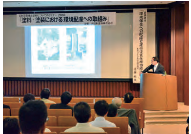
「DNT環境セミナー」大阪会場風景

開催地により若干内容が異なりますが、基調講演では、地球環境の保全と建築塗装における取組みについて講演しました。また、セミナーでは各分野に分かれて、建築塗料の「時代は環境配慮へ～進化し続ける最新テクノロジー～」、構造物塗料の「未来への懸け橋となる技術提案!～環境対策&LCC低減の両立を目指して～」、金属焼付塗料の「VOCゼロへの挑戦。究極のLCC塗料を目指して…その3」、環境品質保証の「塗料・塗装の安全な取扱い」などの情報を提供しました。いずれのセミナーも盛況のうちに終わりました。