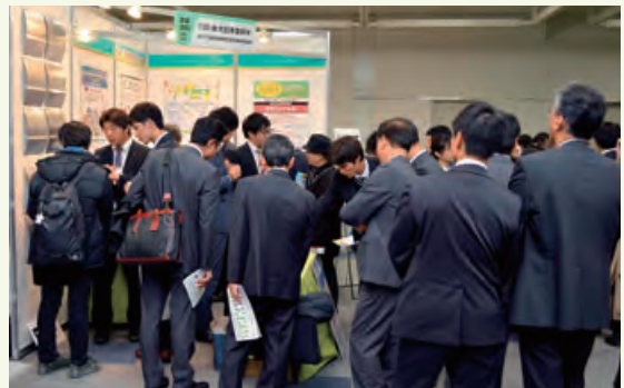
大日本塗料(株)ブースの風景

なかでも2015年にNETISの推奨技術に選定された塗布形成地調整軽減剤「サビシャット」や、貼紙・落書き防止クリアー「マジックアート」などがお客様の注目を浴びていました。