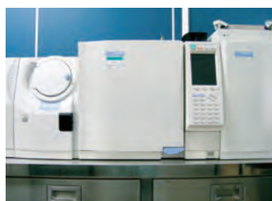
小型チャンパー法VOC測定装置