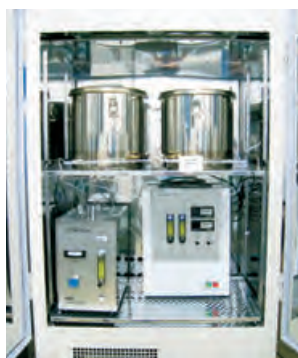
小型チャンパー法 VOC測定装置

研究・開発、生産管理などの部門では、化学物質による環境負荷が生じないように、最新の設備機器を導入して環境分析を実施しています。