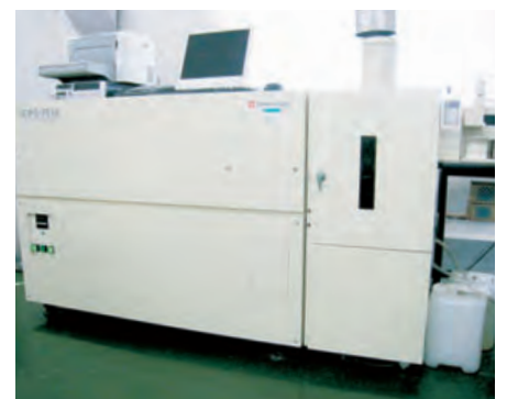
誘導結合プラズマ(ICP)発光分析装置