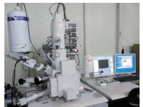
走査型電子顕微鏡