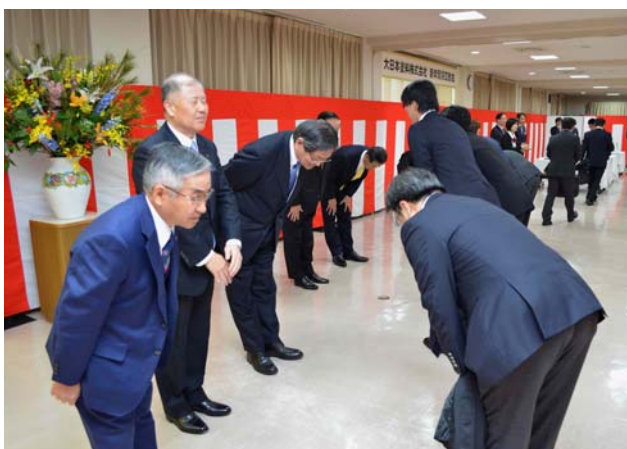
「賀詞交歓会(大阪本社)」風景

2016年1月、大阪本社と東京営業本部において賀詞交歓会を開催しました。会場では取引先や協力会社などへ感謝の意を表わすとともに、当該年度は①国内塗料事業の高付加価値化②海外塗料事業の積極拡大③新収益源事業の育成・強化、を経営運営の要点として掲げた中期経営計画の決意を表明しました。