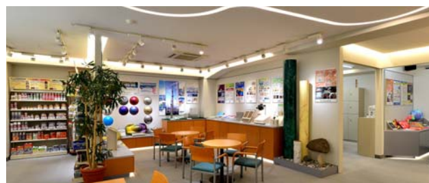
DNTグループショールーム

当社の新商品をはじめ、カラープランを提案する住まいの塗り替えコーナーのほか、家庭用塗料の店頭展示、ブラックライトで照射する幻想的な世界など、役に立つ情報を楽しくご覧いただけます。ぜひ一度お立ち寄りください。