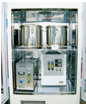
小型チャンパー法 VOC測定装置

研究・開発、生産管理などの部門では化学物質による環境負荷が生じないように最新の設備機器を導入して環境分析を実施しています。