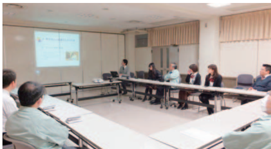
コンプライアンス研修風景

2012年度は従業員を対象にした研修を実施し、業種別に日常業務から生じる可能性のあるコンプライアンス違反について、映像を用いたケーススタディを行いました。