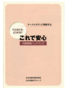
内部統制ハンドブック

2007年3月には、内部統制の考え方やルールをグループ全体に定着させ、企業体質を強化するため『内部統制ハンドブック』を作成して全グループ役員および従業員に配布し、日常的に活用しています。また、内部統制の仕組みが有効に機能しているかを常に確認するため、①監査役による監査②内部監査室による監査③監査法人による監査④職制によるチェックの4通りの監査を行っています。