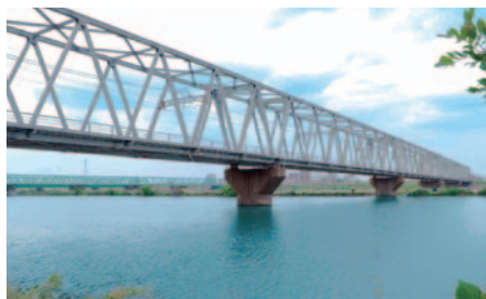
橋梁のコンピューターグラフィックス事例：塗り替え前

一方で各種団体の講演会や勉強会で「景観色彩」についての解説を行い、美しい都市環境や快適な生活環境の実現に取り組んでいます。