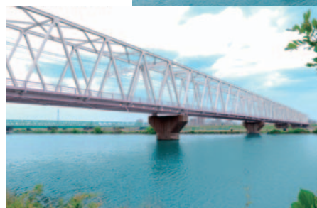
塗装後のイメージB案

江戸っ子が好んだ紫を意識した粋な配色。郷土の人々の心に残る、魅力的な景観を創ります。