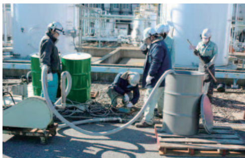
那須事業所の漏洩訓練

有害な化学物質が外部に漏れ出すと地域社会と周辺環境に深刻な影響をもたらすため、那須および小牧の両事業所では漏出事故に迅速に対応するための訓練を定期的に行っています。