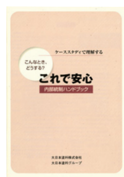
内部統制ハンドブック

2007年3月には、内部統制の考え方やルールをグループ全体に定着させ、企業体質を強化するため『内部統制ハンドブック』を制作して全グループ従業員に配布し、日常的に活用しています。また、内部統制の仕組みが有効に機能しているかを常に確認するため、①監査役による監査②内部監査室による監査③監査法人による監査④職制によるチェックの4通りの監査を行っています。