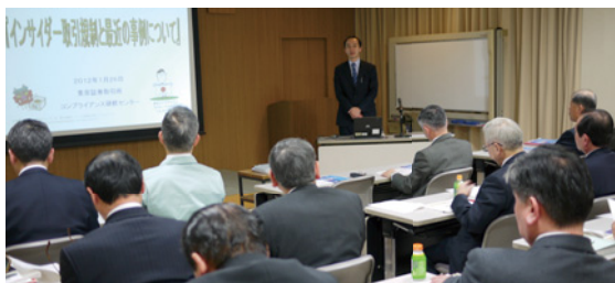
基幹職対象インサイダー取引規制研修

コンプライアンスの中でも特に重要性が高いとされる「インサイダー取引規制」については、東京証券取引所から株取引に関する専門家を招いて役員及び基幹社員を対象とした研修を行いました。