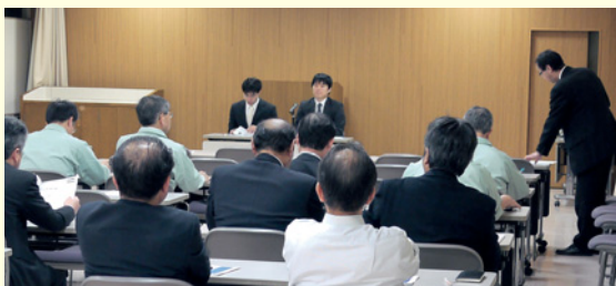
「基幹職対象インサイダー取引規制研修」

コンプライアンスの中でも「インサイダー取引規制」などとくに重要性が高いと思われるテーマについては外部から株取引に関する専門家を招き、幹部社員を対象とした研修を行いました。