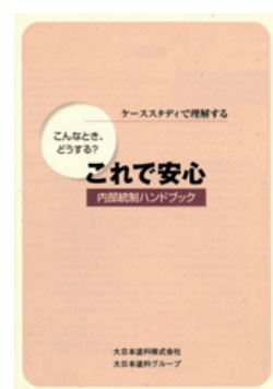
内部統制ハンドブック

2007年3月には、内部統制の考え方やルールをグループ全体に定着させ、企業体質を強化するため『内部統制ハンドブック』を作成して全グループ社員に配布し、日常的に活用しています。また、内部統制の仕組みが有効に機能しているかを常に確認するため、①監査役による監査②内部監査室による監査③監査法人による監査④職制によるチェック、の4通りの監査を行っています。