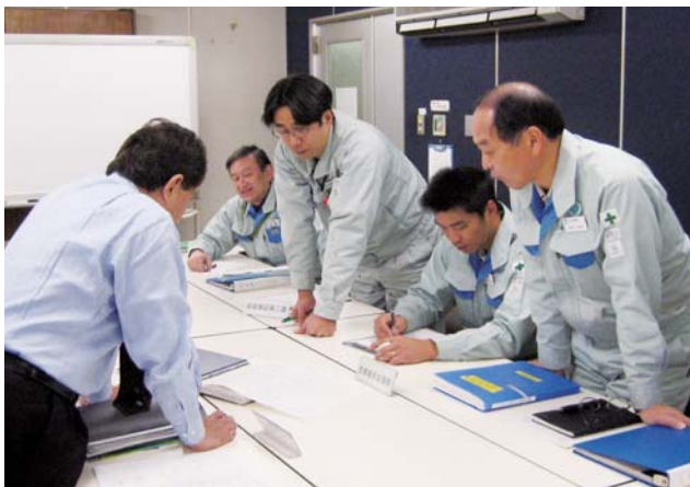
ISO9001品質システムの認証機関による審査