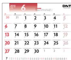
「2010DNTカレンダー」一般の人の見え方

「DNTカレンダー」では休日の指定色に見やすい色の選定や、平日と土曜・日曜を区分しやすい独自の縁取り数字を採用しています。