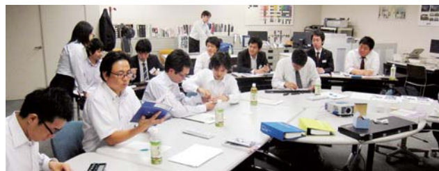
「色彩入門コース」研修風景

一方、中堅以上の方を対象とした座学は、効率的な営業活動を行うための「営業スキル向上コース」や、最近の安全・環境に関する知識を学ぶ「環境安全コース」を、塗料に関しては、業種ごとに専門的な知識を学ぶコースを実施しました。