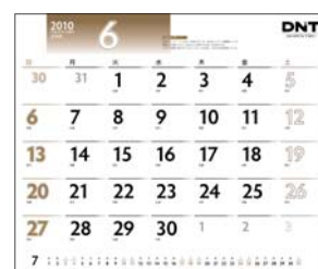
D型(2型)の方の見え方