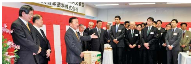
「賀詞交歓会(東京営業本部)」風景

百年に一度と言われる大不況から回復基調に戻りつつあるとはいえ、依然先行き不透明な状況という厳しい経済環境下にありましたが、2009年7月に創立80周年を迎えた当社が、新たな歴史を創り上げるべく、その決意を表明するとともに、お取引先に感謝の意を表すという趣旨で開催しました。来場者には山下社長名の「平成22年新年ご挨拶文」を配布しました。