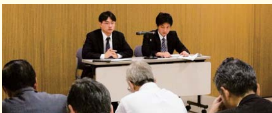
「役員対象インサイダー取引規制研修」

研修では大日本塗料グループがこれからも健全な会社として存続し続けるために何が必要なかを学び、それを一人ひとりが自分自身のものとしてしっかり身に付けることを目的としています。