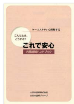
内部統制ハンドブック

また、内部統制の仕組みが有効に機能しているかを常に確認するため、①監査法人による監査②内部監査室による監査③職制による監視、の3通りのチェックを行っています。